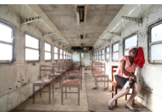
Imaginary I