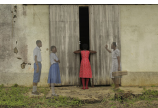
Imaginary II