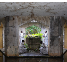
Terre de lait, terre de miel